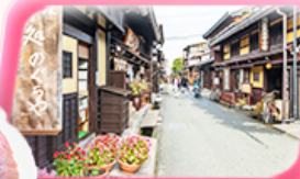
ทาคายามา