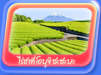
ไร่ชาที่โอบุจิ ชะชะปะ

Highlight สัมผัสความเป็นญี่ปุ่น ชมวิวฟูจิที่ ทะเลสาบยามานากะโกะ ศาลเจ้าฟูจิซังเซเนงง "Unseen" ขอบพระด้วยหิวโซเท้า ที่วัดมัตสึชิมาม่า โซเดิน ถ่ายภาพวิวไร่ชาที่ โอบุจิ ชะชะปะ ขอบพระ วัดอาซากุสะ วัดพระใหญ่อุซึคุ โดบุทสึ เดินเล่น คาวาโกเอะ Toyosu Senkyaku Banrai ซุปปิ้งย่านชินจูกุ และห้างโตเวอร์ซิตี