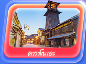
คาวาโกเอะ