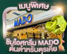
เมนูพิเศษ ชิมโอสครีม MADO ต้นตำหรับตุรกี