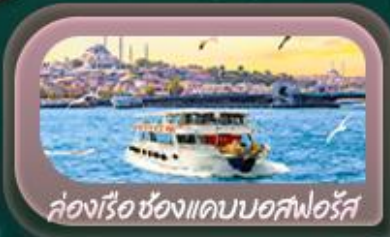
ล่องเรือ ช่องแคบบอสฟอรัส