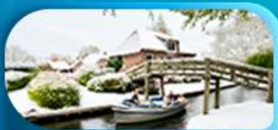
ล่องเรือชมหมู่บ้านทึโรธิน

พิเศษ ล่องเรือแม่น้ำเซน ชมเมือง โดย บาโต มูช