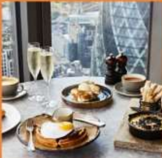
DUCK AND WAFFLE