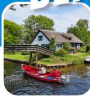
ท่องเที่ยวครบ ตลอดการเดินทาง