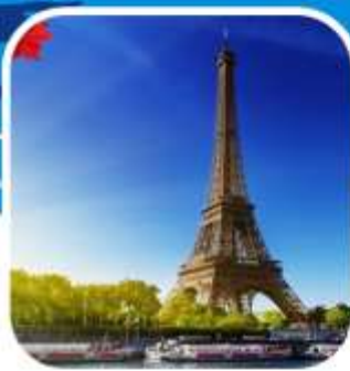
อาหารพิเศษเมนู พื้นเมือง