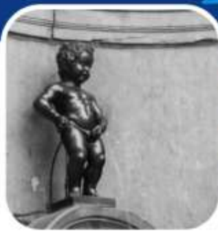
โรงแรมที่พัก 4 ดาว