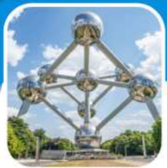
ช้อปปิ้ง มหานครปารีส

ล่องเรือชมแม่น้ำไรน์ เมือง เซนต์กอร์ - บ็อบพาร์ท ชมเมือง โคโลญ มหาวิหารโคโลญ เที่ยวเมือง กิ์รูน ล่องเรือ ชมหมู่บ้าน ชมเมืองไวเลนดัม ซานสคัน อัมเตอร์ดัม เมืองหลวง เนเธอร์แลนด์ ล่องเรือหลังคากระฉก ชมสถาบันเพชร ล่องเรือชมเมืองเก่าบรูจจ์ บรัสเซลส์ ชมอะตอมเมียม เข้าสู่ปารีส เข้าพระราชวังแวร์ซายส์ อิสระช้อปปิ้ง ล่องเรือแม่น้ำแซนนด์