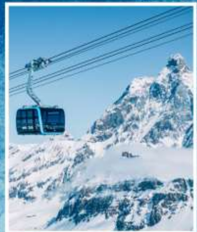
GLACIER PARADISE TOP OF ZERMATT