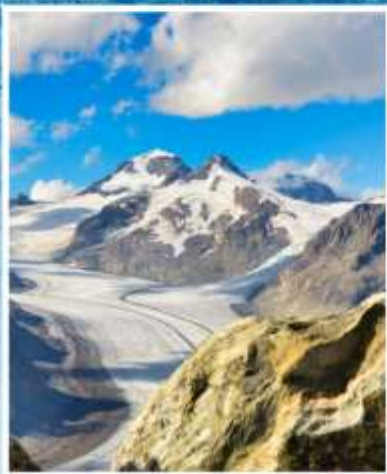
ALETCH GLACIER Riederalp, Bettmeralp

แกรนด์สวิตเซอร์แลนด์ 9 วัน พักหมู่บ้านเชอร์แมท