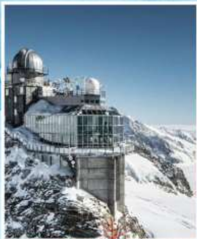
JUNGFRAUJOCH "Top of Europe"