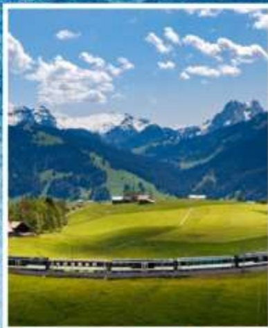
GOLDEN PASS LINE Montreux-Zweisimmen