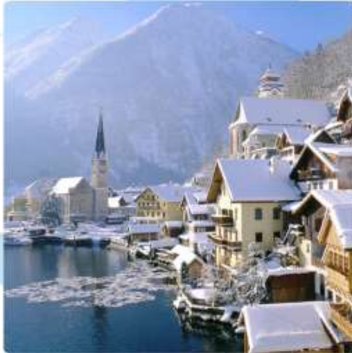
ออสเตรียบาวาเรียดินแดนแห่งเทพนิยาย