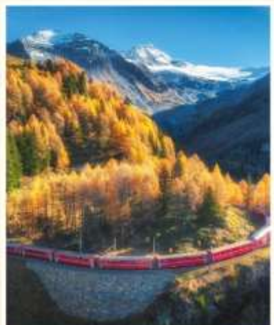
BERNINA EXPRESS GoldenPass Express