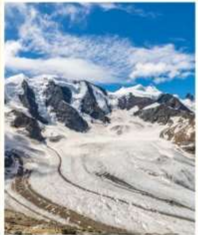
DIAVOLEZZA Piz Bernina Peak