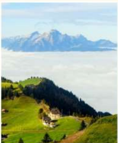
RIGI KULM Lucerne Cruise