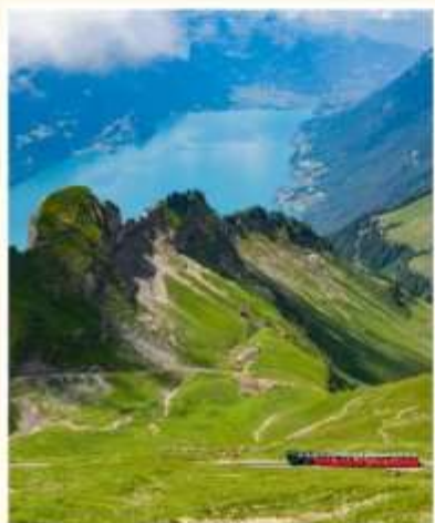
BRIENZER ROTHORN Sorenberg Schonenboden