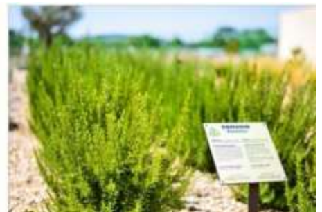
The Mediterranean Garden