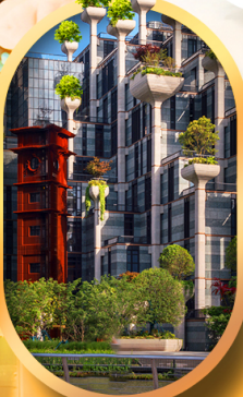
อาคารพินตันไผ่