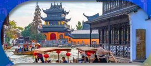
Zhujiajiao Ancient Town ส่องเรือเมืองโบราณ

เชียงใหม่ ดิสนีย์แลนด์ เมืองโบราณจูเจียเจียว