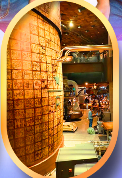
ร้านสตาร์บัคส์