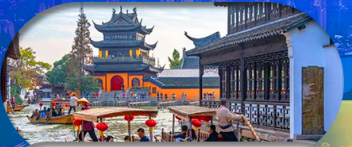
Zhujiajiao Ancient Town ล่องเรือเมืองโบราณ

เซี่ยงไฮ้ ดิสนีย์แลนด์ เมืองโบราณจูเจียเจียว