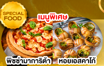
พิซซ่ามาริตต้า หอยออสคาโก้