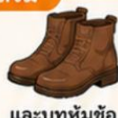
และบูทหุ้มข้อ