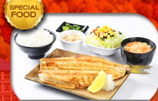
SPECIAL FOOD เมนูพิเศษ Set ปลาซอกเกะ