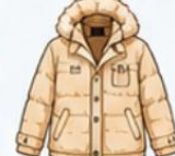
เสื้อโค้ทกันหนาว ตัวหนา