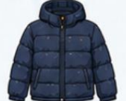
เสื้อขนเป็ด