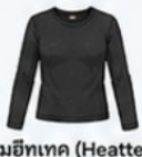
สวมฮีทเทค (Heattech) แบบหนาที่เค็นดำนใน