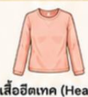
สวมเสื้อฮีทเทค (Heattech) ไร์ดำนในเพื่อเพิ่มความอบอุ่น แทนการใส่เสื้อหลายๆ ชั้น