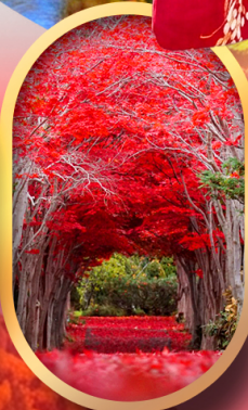
สวนฮิราโอกะ