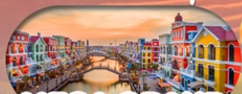
MEGA GRAND WORLD HANOI แลนด์มาร์คแห่งใหม่