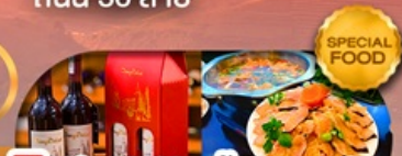
พิเศษเมนู สุกี้ปลาเซลม่อน ลัมรสไวน์แดงชื่อดัง เดินทาง ต.ค. 69 เป็นต้นไป