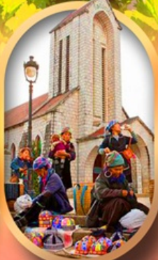
โบสถ์หินซาปา