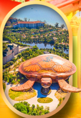
พิพิธภัณฑ์สัตว์น้ำ