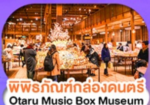
พิพิธภัณฑ์กล่องดนตรี Otaru Music Box Museum