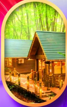
นิงเกิลทอรัส