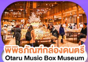
พิพิธภัณฑ์กล่องดนตรี Otaru Music Box Museum