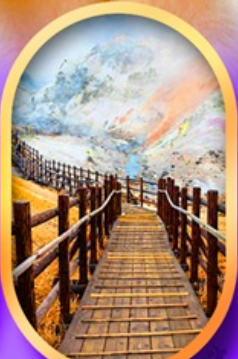
จิกุคคาบิ