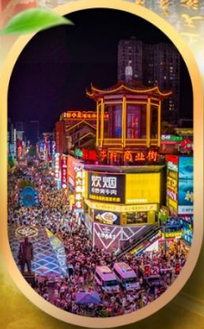
ถนนคนเดินซิงหลู่