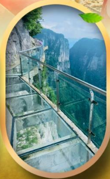
ทางเดินกระจกริมผา