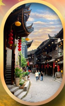
เมืองโบราณฟุหลงเจิ้น