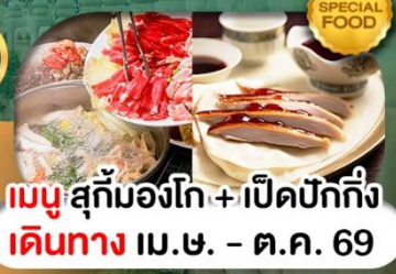
เมนูสุกั่มองโก + เปิดปักกิ่ง เดินทาง เม.ษ. - ต.ค. 69