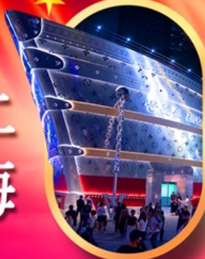
เรือคอสเพลย์