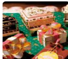
กล่องดนตรี MUSIC BOX