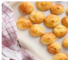
ร้าน KITAKARO ซึ่งเป็นแบบอบจากเตาถ่าน ใช้น้ำให้ร้อนจนลิ้นจี่กับเมล็ดยี่งอ และเนยทาโร่ซึ่งของฝากเป็นอย่างไร