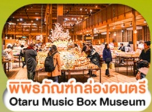
พิพิธภัณฑ์กล่องดนตรี Otaru Music Box Museum