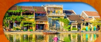
HoiAn Ancient Town ย่านเมืองเก่าฮอยอัน