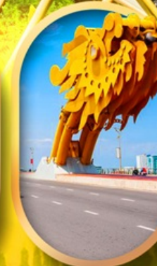
สะพานมังกรดามิง