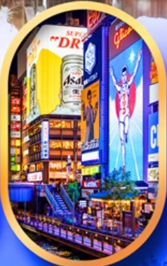
ย่านชินโซบาชิ