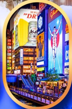
ย่านชินโซบาชิ