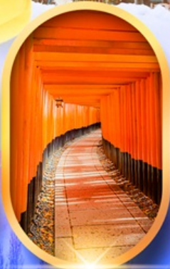
เมืองเก่าทาคายามา