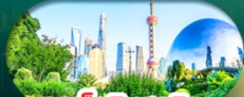
จุดเช็คอินสุดฮิต North Bund Shanghai

เซี่ยงไฮ้ หางโจว ล่องทะเลสาบซีหู ฟรีเดย์