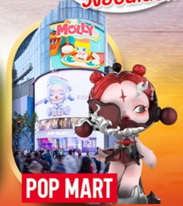
ช้อปปิ้งร้าน Pop Mart