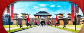
Hengdian World Studios โรงละครจำลองที่ใหญ่ที่สุดในโลก

เชียงใหม่ หางใจ หึงเตียน ล่องเรือทะเลสาบซีหู