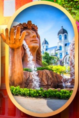
น้ำตกเทพพิสดง