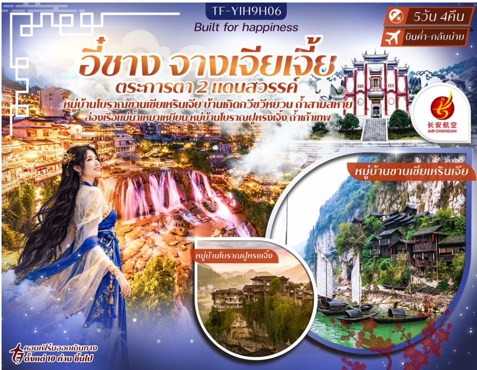
หมู่บ้านชานซีเหรินเจีย