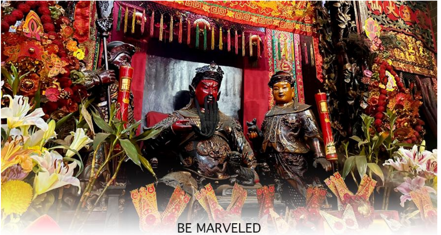
BE MARVELED วัดกวนอู

สัญลักษณ์แห่งความเข้มแข็งโดดเด่น ไม่ครั้นคร้ามต่อศัตรู ฉะนั้นการมาบูชาขอพรท่าน จะช่วยเสริมดวงไม่ให้ เปลืองพลา้แก่ศัตรู ทำให้มีมิตรที่ซื่อสัตย์ และคุ้มครองบริวารให้ก้าวหน้าและอยู่เย็นเป็นสุข ซึ่งผู้ประกอบอาชีพ ตำรวจ ทหาร และ นักการเมือง จึงมักจะนิยมบูชาเทพเจ้ากวนอู เป็นพิเศษ