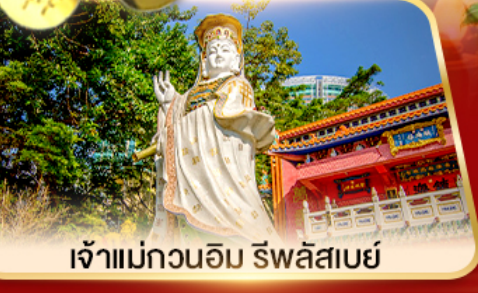
เจ้าแม่กวนอิม ธิพลสถิตย์