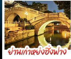
ย่านเก่าเซียงซิงฟาง