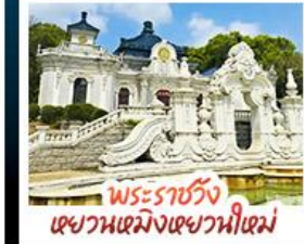
พระราชวัง เซหวานเซมิงเซหวานีเซม