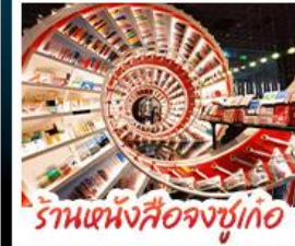
ร้านหนังสือจุงซูเกอ