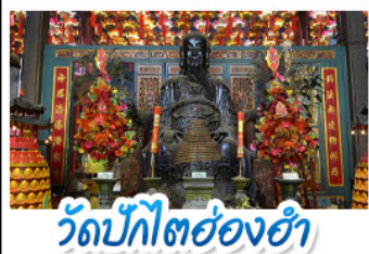
วัดปึกโตฮ่องกง