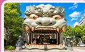
ศาลเจ้านิมมะ ยาชากะ