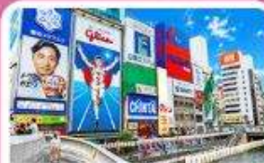
ชิบโฮบาชิ