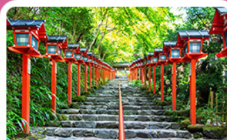
ศาลเจ้าคิฟูเนะ