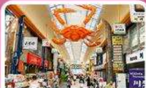
ตลาดคูปอง

เดินทาง 03 - 07 ก.ค. 69 | 19 - 23 ส.ค. 69 | 25 - 29 ก.ย. 69