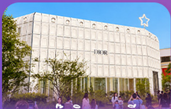
บรูกลลนเกาหลล