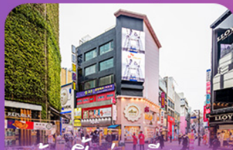
ช้อปปลง่านเมมขงดง