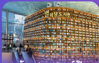
ตึງสูงมุดลตารฟลค

เก็บทุกไฮไลท์ ในกรุงโซล ตั้งแต่ความงดงามของ พระราชวังเคียงบ็อก ชมวิวสุดอลังการที่ ตึกลีตตเต โซลสกาย (รวมค่าลิฟต์ขึ้นตึก) สนุกสุดมันส์ที่ สวนสนุกลือตเต วิลล์ (รวมค่าบัตรเครื่องเล่น) พลิคเพลินไปกับโลกใต้ทะเล ล้อตเต อควาเรียม (รวมค่าบัตรเข้าชม) เข็มอินแลนด์มาร์กสุดฮิตอย่างห้องสมุดสตาร์ฟิล โคเอกมอลล์ เดินเล่นย่านฮิป บรูกลินเกาหลี ชองชุง และช้อปปิ้งซัมเมอร์ซล สุดฟิน ย่านเมืองคงและองแด