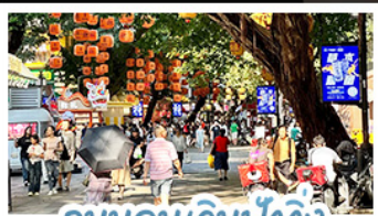
ถนนคนเดินปักกิ่ง