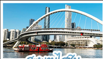
สะพานไอซัน

บินตรงกวางโจว • จัดเต็มเที่ยวสวนสนุกกลางแขวงเต็มวัน เที่ยวจีนฟีลยุโรป ชมสถาปัตยกรรม ณ เกาะซาเหมียน สักการะวัดพระใหญ่ พูธรูปเก่าแก่กว่า 1,000 ปี ใจกลางเมืองกวางโจว เช็คอินกับแลนด์มาร์คสุดฮิตจตุรัสฮวาเหมิ ถ่ายรูปกับหอทีวี ช้อปปิ้งเพลิน ถนนคนเดินอีต้อและถนนคนเดินปักกิ่ง