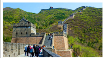
กำแพงเมืองจีนด่านจวิ๊ยงกวน