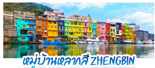
หมู่บ้านหลากสี ZHENGBIN

เสริมบารมี ขอพร "เทพเจ้ากวางอู" ณ วัดเว่ยเทียน เสริมอำนาจ การงาน เปิดดวงโชคลาภ "เจ้าแม่มาจู่" วัดจงชานซือโฮ่ว วัดที่มีดวงจตุศที่สวยแห่งหนึ่งในไทเป TAIPEI 101 เซ็คอินตึกสูงระฟ้าสัญลักษณ์แห่งไต้หวัน • ถ่ายรูปที่หมู่บ้านหลากสี จิวเฟิน สัมผัสบรรยากาศโรงน้ำชาสุดคลาสสิก • ปล่อยโคมลอยซือเฟิน (4 ท่า/โคม) แหล่งรวมแฟชั่นและของกิน ย่านซีเหมินติง • ตลาดกลางคืนเกาหยวน ตลาดพราหมณ์ รมร้าน MICHELIN GUIDE มากที่สุดในไต้หวัน