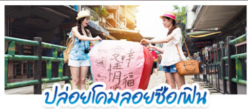
ปล่อยโคมลอยซือเฟิน