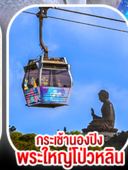
กระเช้าองปิงพระใหญ่โป่วหลิน