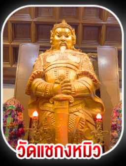
วัดเขกงหมี