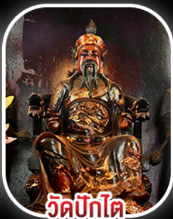
วัดบิกโต