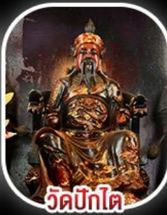
วัดบิกไค