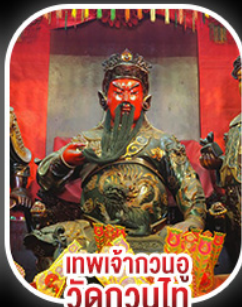
เทพเจ้ากวนอู วัดกวนโถ