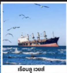
เรือบลู เวสต์