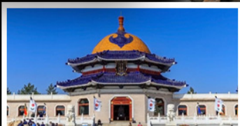
สุสานเจกิสซ่าน