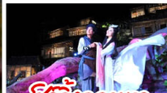
ชีวิตจิ้งจอกขาว