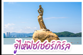
จุ้เซ่ฟิซเซอริทริค