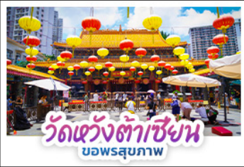
วัดเซ้งต้าเซี่ยน บอพรสุภภาพ