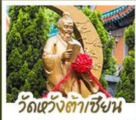
วัดแ่ว้งถ้ำเซ้ชง