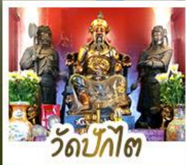
วัดป้กไต่