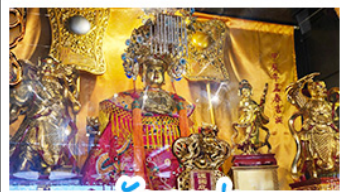
วัดอาเมา