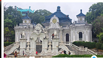
พระราชวังหยวนหมิงหยวน