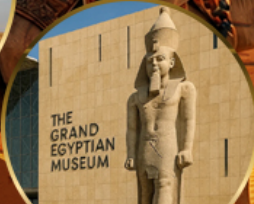
พีพีรภัณฑ์แกรนด์อียิปต์