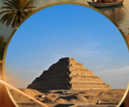
พีระมิดขั้นบันได