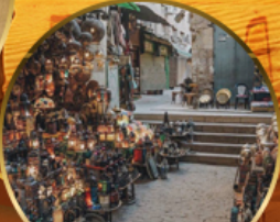
ตลาดย่านเอลคาลิลี