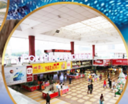
ตลาดก่งเปี้ย