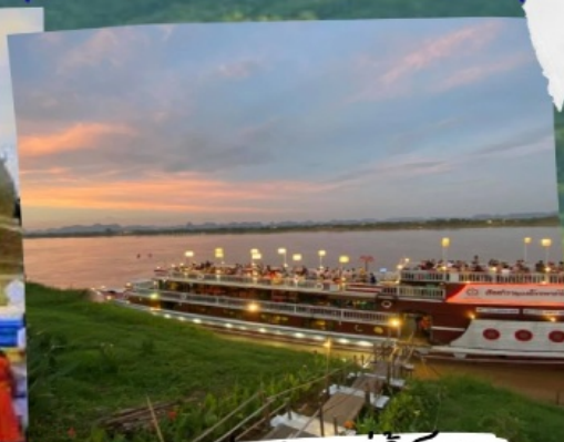
ลองเรือแม่น้ำโขง