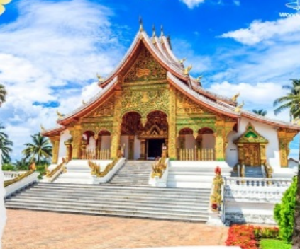
พระราชวังหลวง