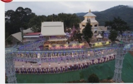
สกายเวิลด์

2 ท่านขึ้นไป 14,499 บาท/ท่าน 4 ท่านขึ้นไป 12,799 บาท/ท่าน