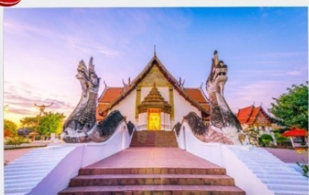
วัดภุมรินทร์