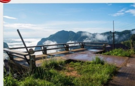
ดอยฟ้าชี