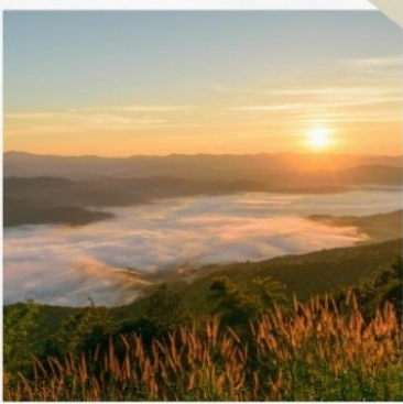
ตอย/สมอทาว

2 ทันขึ้นไป 14,499 บาท/ท่าน 4 ทันขึ้นไป 12,799 บาท/ท่าน 6 ทันขึ้นไป 10,999 บาท/ท่าน